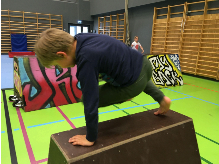
Urjalan kaupungin lyhytkurssi.

https://www.youtube.com/watch?v=aA6aMKaaQck https://www.youtube.com/watch?v=aA6aMKaaQck