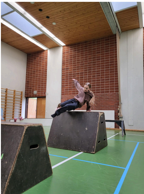
Keuruun lajikokeilu.