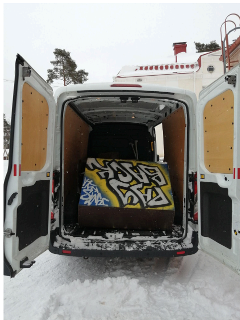
The Parkour-paku.